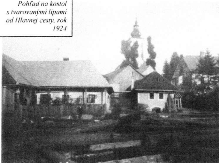
Pohľad na kostol s tvarovanými lipami od Hlavnej cesty, rok 1924

Zeleň v chránenom území tvoria predovšetkým záhrady, sprievodná zeleň neregulovanej časti potoka, zeleň cintorína a solitérne dreviny pri sakrálnych objektoch. V záhradách rastú na plochách trávniká prevažne ovocné dreviny, prevládajú jablone ( Malus sp. ). V častiach záhrad priliehajúcich k kuličnému priestoru nájdeme výsadby trvaliek a listnatých krov (orgován obyčajný, Syringa vulgaris ). Negatívnym javom v chránenom území sú farebne a tvarovo odlišné formy introdukovaných, nepôvodných drevín narušajúce krajinný obraz prírodného prostredia a nerešpektujúce historické súvislosti v chránenom území. Pri potoku v severnej časti sa nachádzala jednostranná aleja topol'a kanadského ( Populus x canadensis ), vyrezaná v roku 2008. V chránenom území sa nachádzajú v sprievodných výsadbách potoka viaceré nevhodné druhy introdukovaných drevín (borievka čínska, Juniperus chinensis 'Tripartit' ). Rastú tu tiež prirodzené brehovú porasty. K významnej historickej zelene v chránenom území patrili dve lipy veľkolisté ( Tilia platyphyllos ) rastúce pri kostole, ktorých vek je odhadovaný na