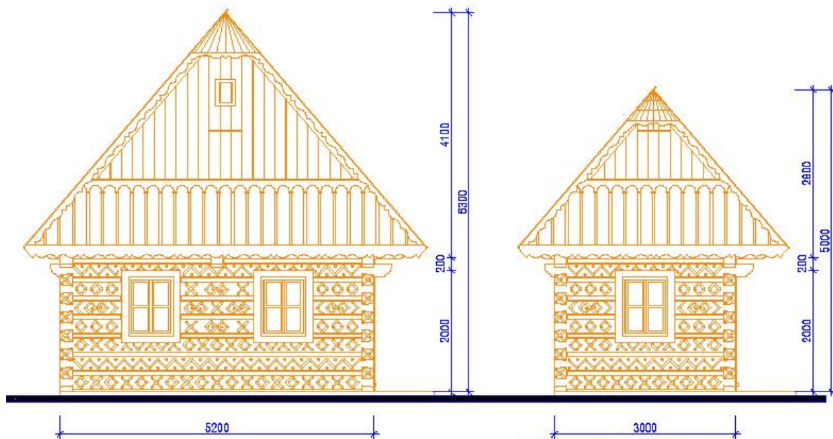
PARAMETRE SKUTOČNÉHO DOMU

PARAMETRE PREDPOKLADANEJ MAKETY S POMERNÝM ZMENŠENÍM PODORYSNÝCH ROZMEROV ZACHOVANÁ VÝŠKA STAVBY-DÁ SA DO NEJ VOJST ALE OBJEKT STRÁCA CHARAKTER RODINNÉHO DOMU